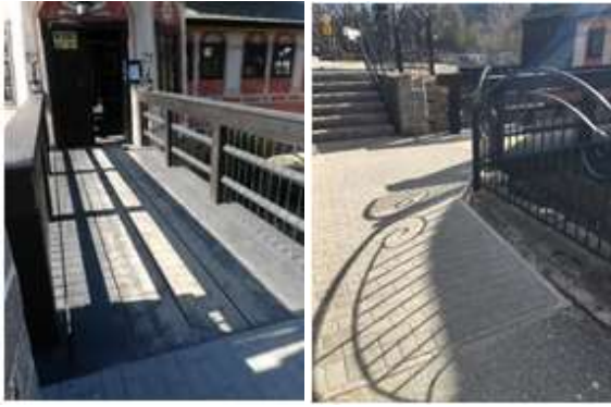
Wejście do muzeum