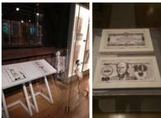
Kopie wypukło-reliefowe wybranych eksponatów