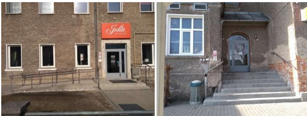
Od lewej strony: Wejście główne i boczne (kasa biletowa, kawiarnia, sklep ze szkłem kolorowym)