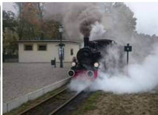
Stacja w Rudach