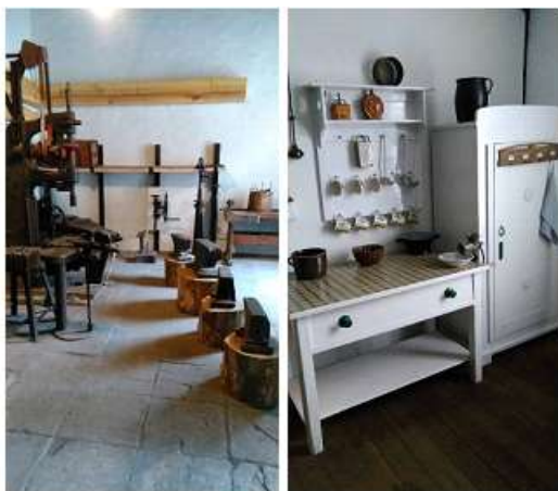
Od lewej strony: kuźnia, izba śląska