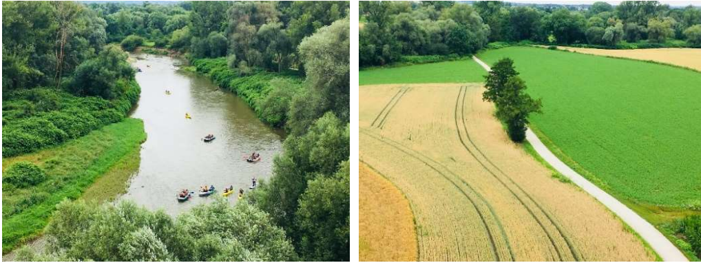
Aussicht aus dem Turm