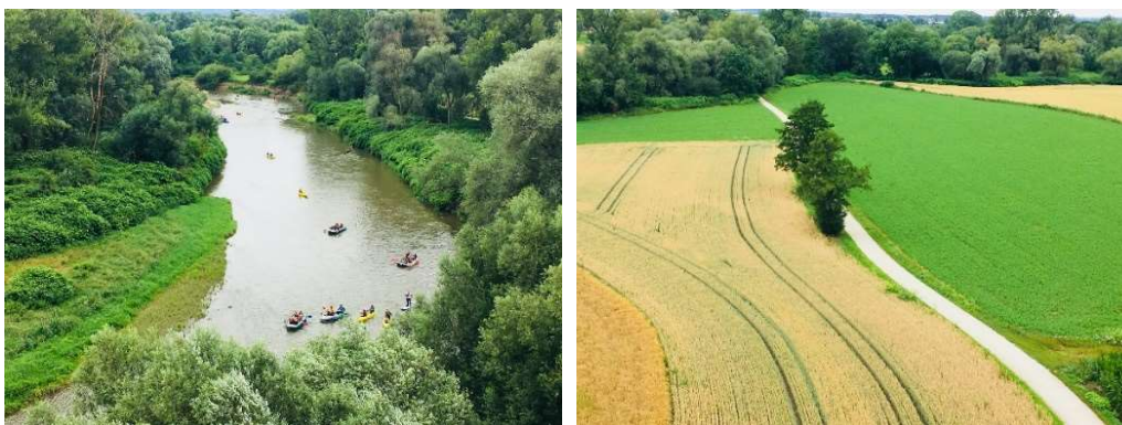
Widok z wieży