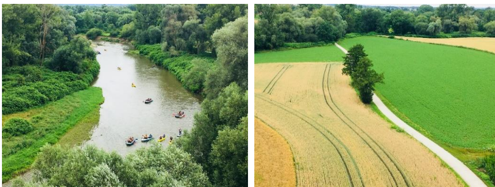
Widok z wieży