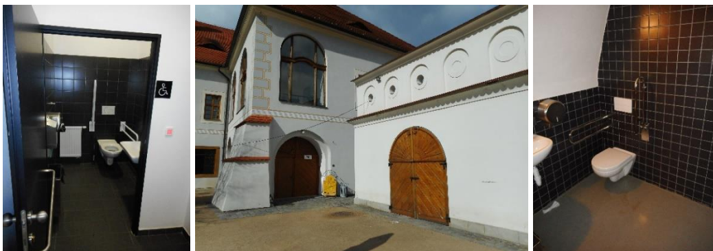
Od lewej strony: WC Smetanovo náměstí, budynek WC w Ogrodach Klasztornych, WC w ogrodach Klasztornych