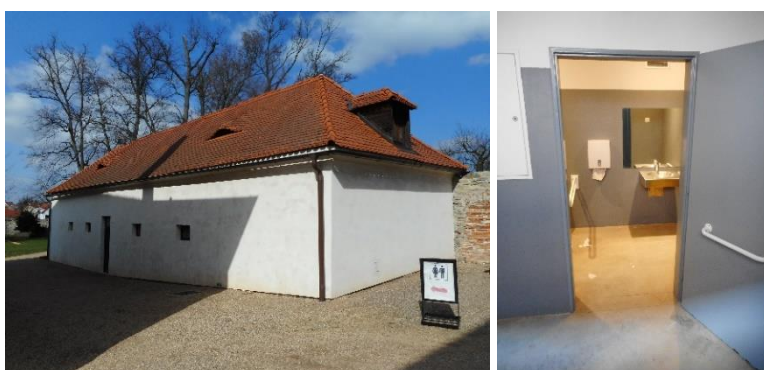
Od lewej strony: Budynek WC na obszarze kompleksu pałacowego, wejście do kabiny toaletowej bez barier architektonicznych – kompleks pałacowy