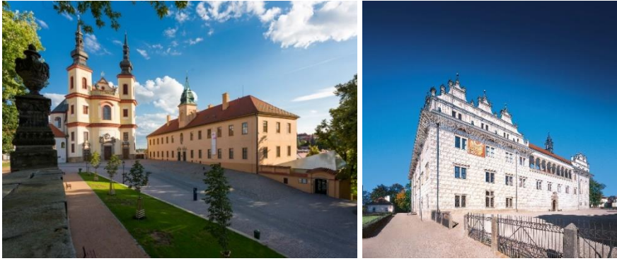
Od lewej strony: Zámecké návrší (Wzgórze Pałacowe), pałac