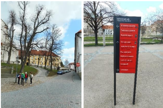
Od lewej strony: Kościół Podwyższenia Krzyża św. i droga na rynek, oznaczenia w mieście