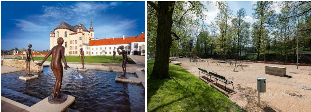
Od lewej strony: Ogrody Klasztorne, park Vodní valy