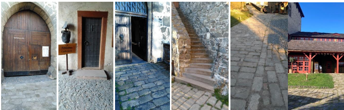
Z lewej strony: Brama główna (wejście do kasy i na dziedziniec), wejście do kasy, wejście do pałacu, schody do kaplicy, nawierzchnia dziedzińca, nowa kasa