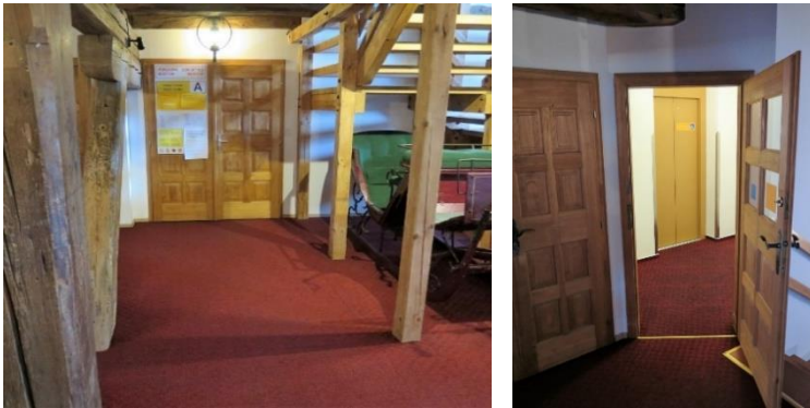
Von links: Wege Innen (Zugang zur Ausstellung A), Zugang zum Fahrstuhl in der 2. Etage auf der Route A