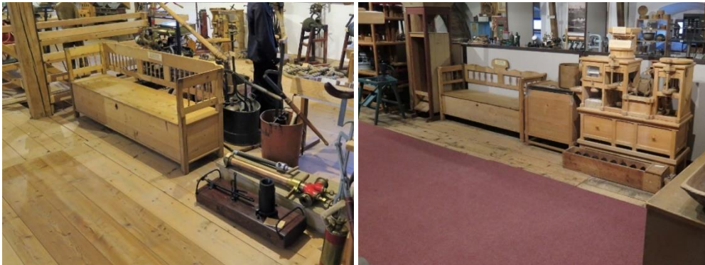
Ausstellungsräume Besichtigungsrouten A