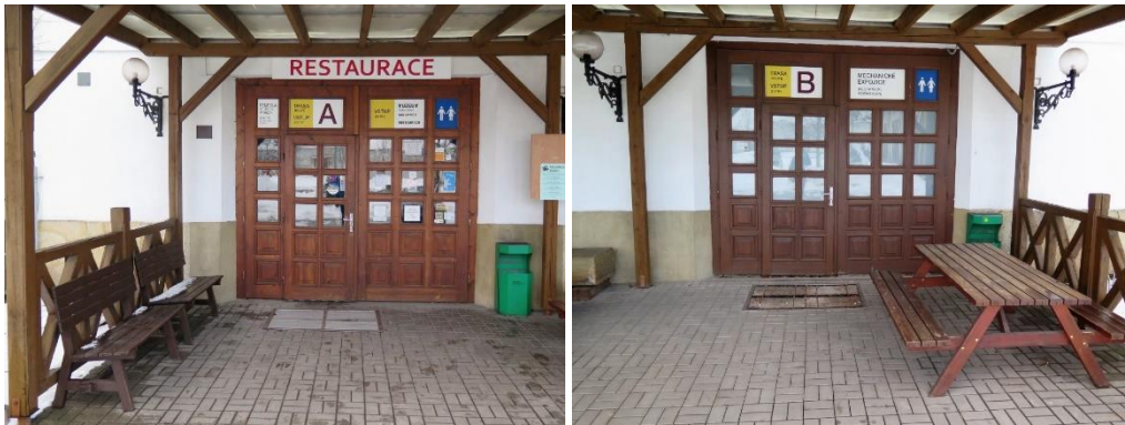
Von links: Eingang zur Besichtigungsrouten A und B