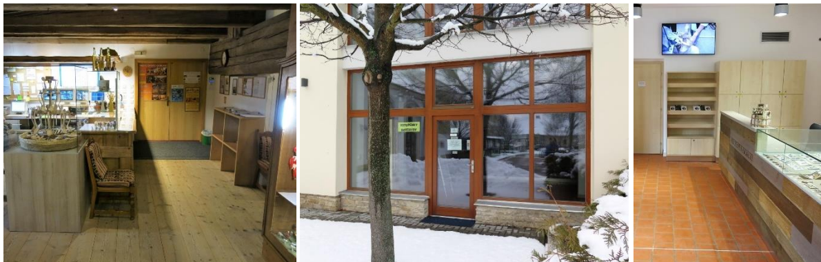
Von links: Hauptkasse zur Route A (im 2. OG), Nebenkasse mit Informationszentrum (Eingang und Innenraum)