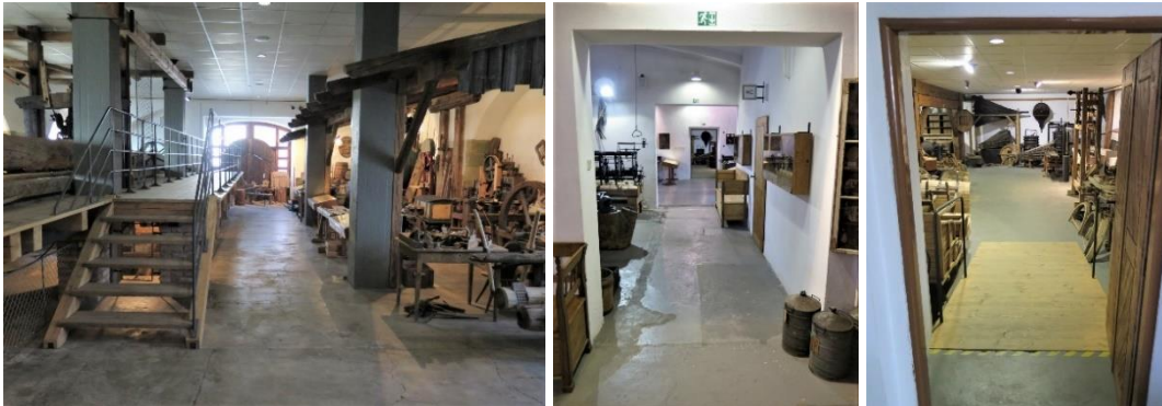
Von links: Ausstellungsräume Besichtigungsrouten B, Wege auf Route B, Rampe auf Route B