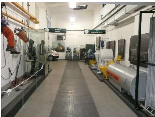
Zleva: Vstup do řetízkových šaten, interiér expozice báňského záchranářství