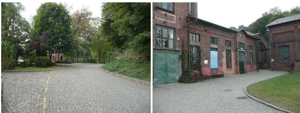
Zleva: Přístupová cesta z parkoviště, přístup k pokladně