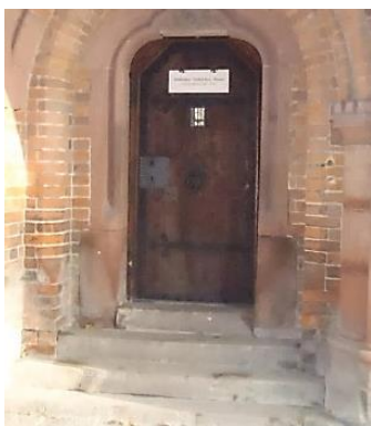
Od lewej strony: Parking, dojście, kasa