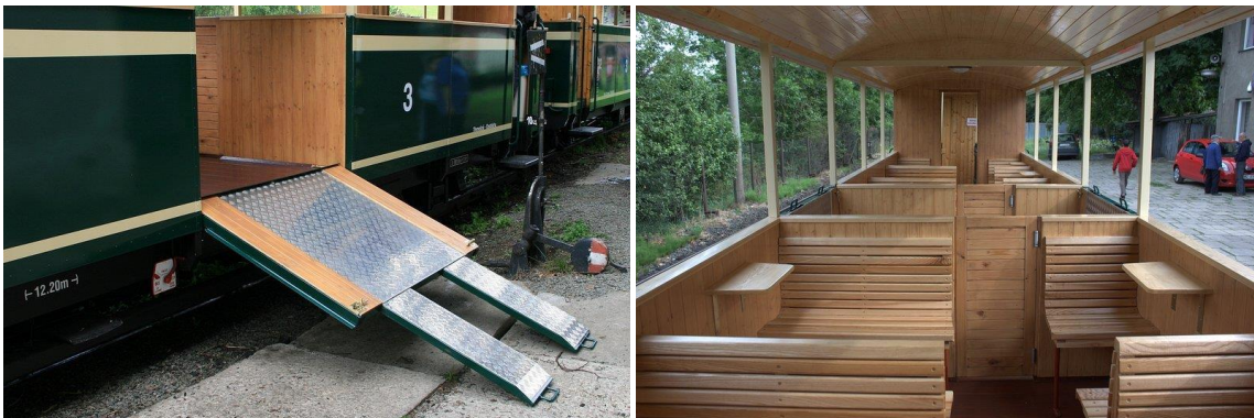
Von links: Kipprampe und das Innere des Wagens zur Beförderung von nicht mobilen Personen