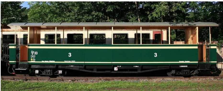
Ausflugswagen zur Beförderung von nicht mobilen Personen