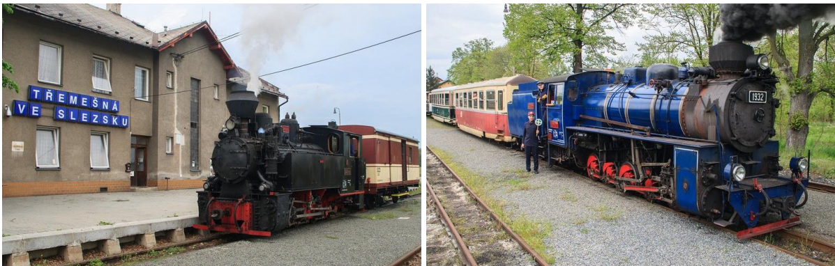
Von links: Bahnsteig in Třemešná und in Osoblaha