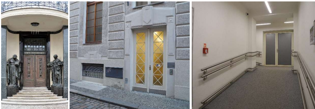
Zleva: Hlavní vstup, boční vstup, rampa u bočního vstupu