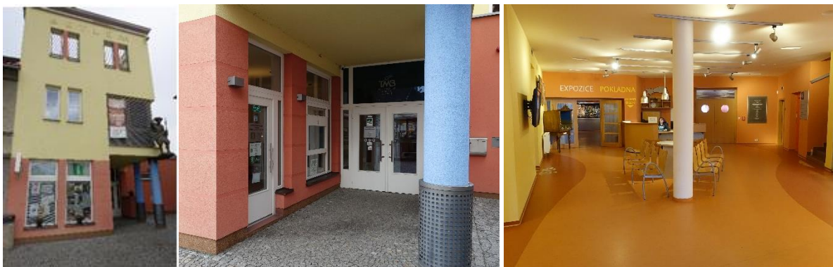
Od lewej strony: Budynek muzeum, wejście do muzeum i obszar wejścia