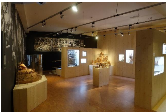
Od lewej strony: Ekspozycja