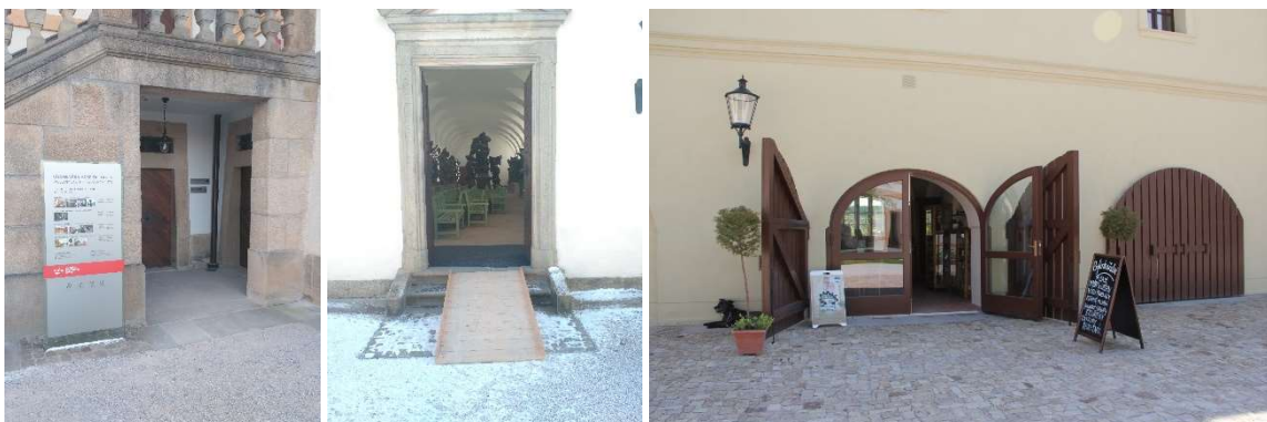
Od lewej: wejście kasa, wejście lapidarium, wejście sklep zielarski