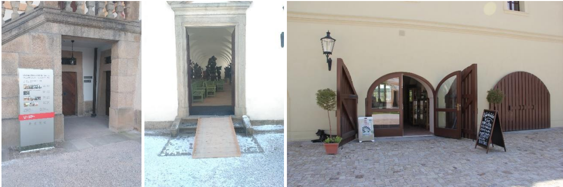
Von links: Eingang Kasse, Eingang Lapidarium, Eingang Kräuterladen