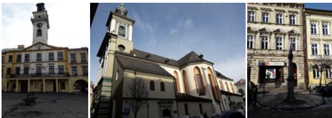
Od lewej strony: Rynek – Ratusz, Kościół św. Marii Magdaleny, Madonna z Dzieciątkiem

Ulicą Głęboką w dół, dalej druga (w kolejności) ulica na prawo - Stary Targ (Madonna z Dzieciątkiem) - ulicą Fredry w stronę Teatru im. A. Mickiewicza i Książnicy Cieszyńskiej. Dalej do góry ul. Głęboką – nad Muzeum Drukarstwa i pierwszą ulicą na prawo Browarną do ul. Śrutarskiej (Studnia Trzech Braci), potem ul. Nowe Miasto do ul. Limanowskiego (Park Pokoju) a stamtąd ul. Regera z powrotem do Rynku.