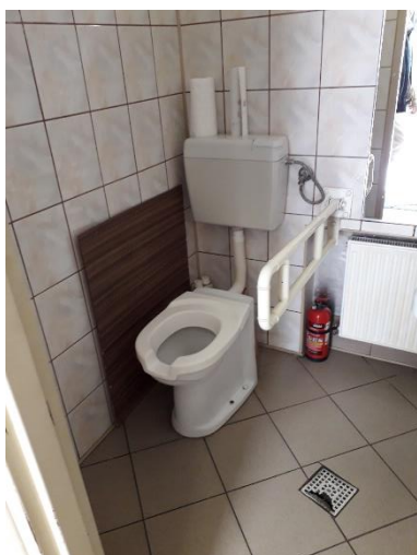
Toaleta publiczna - ul. Ratuszowa