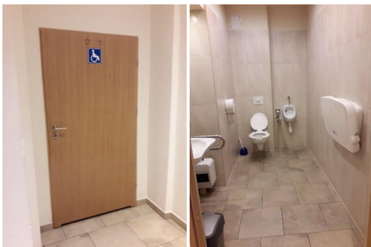
Toaleta na ratuszu