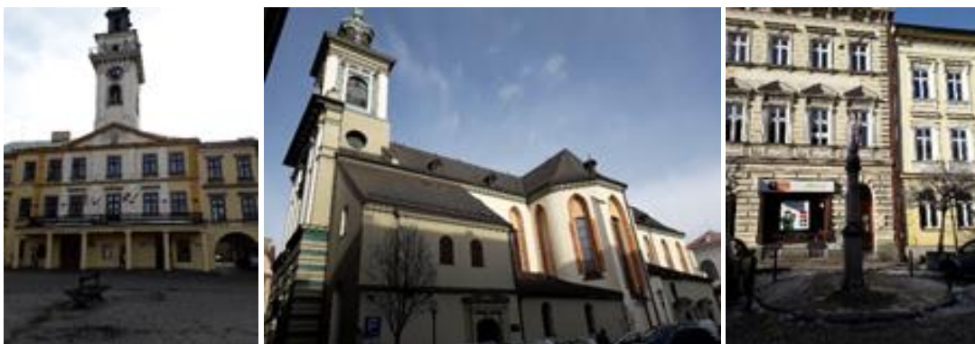
Von links: Der Hauptplatz - das Rathaus, die Maria-Magdalena-Kirche, Madonna mit Kind

Die Strecke führt vom Platz auf die Głęboka-Straße (Hluboká) und dann um die zweite Ecke rechts auf den Stary Targ-Platz (Alter Markt/Stary trh) weiter zur Madonna mit Kind. Die Aleksander-Fredro-Straße entlang gehend kommt man zum A. Mickiewicz-Theater und zur Teschener Bibliothek (Książnica Cieszyńska) gelangt man durch die Plac-Teatralny-Straße und die Mennicza-Straße. Kehren Sie dann von der Mennicza-Straße zurück auf die Głęboka-Straße. Sie können noch ein wenig weiter abwärts zum Druckereimuseum (Museum drukarstwa) gehen, oder den Hügel hinauf gehen, dann an der ersten Ecke rechts (in die Browarna-Straße) abbiegen, an deren Ende dann nach links (in die Śrutarska-Straße) abbiegen und zum Drei-Brüder-Brunnen gelangen. Gehen Sie dann die Śrutarska-Straße und die Nowe-Miasto-Straße entlang, bis Sie an die Kreuzung mit der Limanowskiego-Straße gelangen, mittels der Sie dann zum Friedenspark (Park míru) kommen und dann die Tadeusz-Reger-Straße entlang zum Hauptplatz zurückkommen.