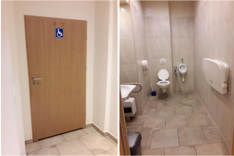
Barrierefreie Toilette im Rathaus