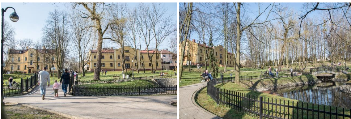
Od lewej strony: Wejście do inhalatorium, promenada główna, drogi komunikacyjne