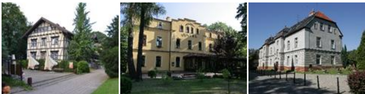
Zabytkowe obiekty w parku

Park Zdrojowy może pochwalić się bogactwem sprowadzonych gatunków roślin. Na obszarze około 18 ha występuje ponad 70 gatunków drzew i krzewów.