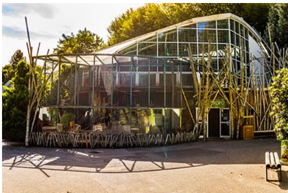
Wejście do pawilonu tropików