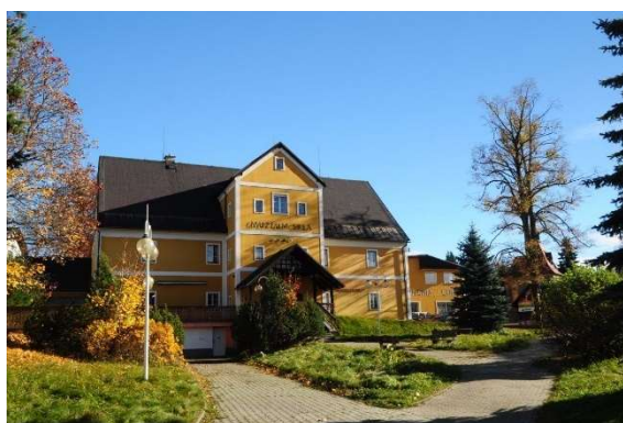
Zleva: Vstup do recepční budovy, objekt muzea