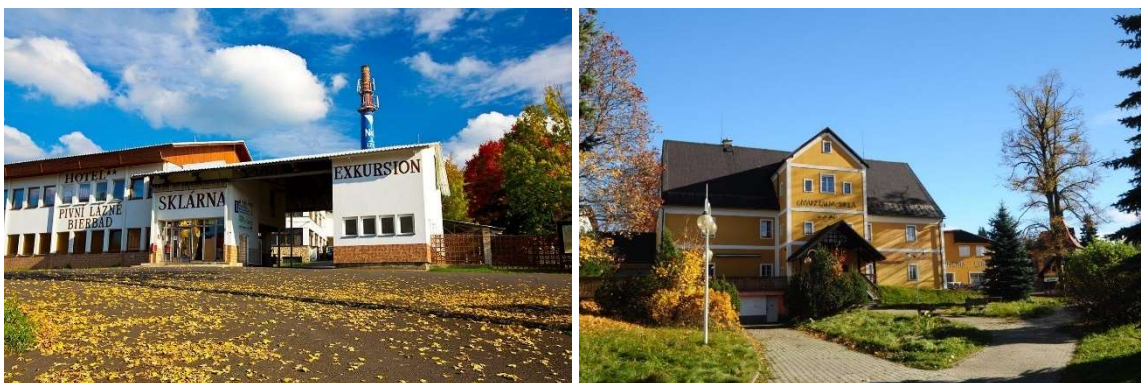
Od lewej strony: Wejście do obiektu recepcji, obiekt muzeum