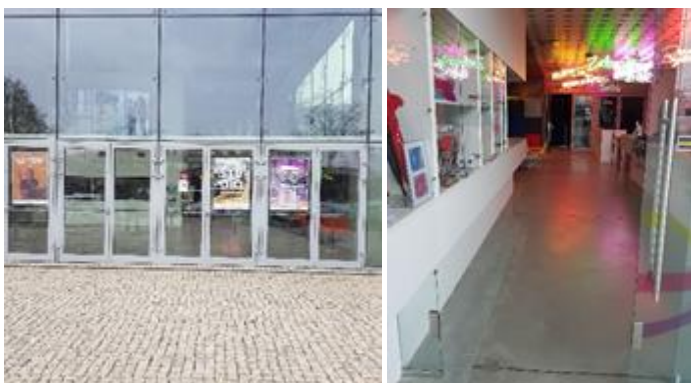
Wejście do budynku Amfiteatru, wejście do muzeum