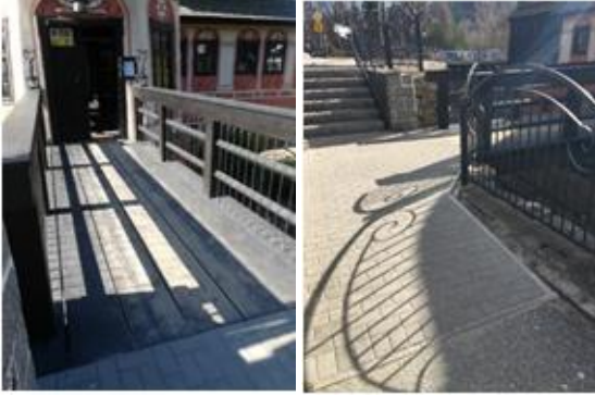
Der Eintritt ins Museum