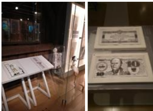
Kopie wypukło-reliefowe wybranych eksponatów