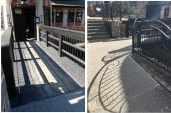
Wejście do muzeum