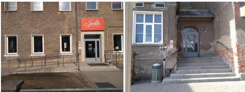
Od lewej strony: Wejście główne i boczne (kasa biletowa, kawiarnia, sklep ze szkłem kolorowym)